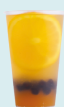
JASMINE & PASSION FRUIT Jasmine, passion fruit, orange