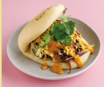
С говядиной и соусом карри 490