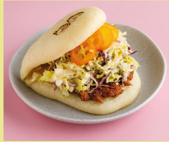
Duck confit with Chinese cabbage 450