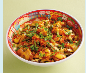
С курицей карааге 550