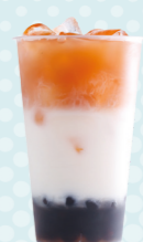
MASALA CHAI Masala, coconut condensed milk, almond milk