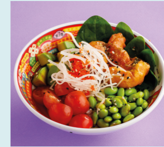
Prawns tempura 650