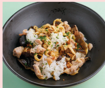
Chicken thigh, tree mushrooms with truffle unagi 490