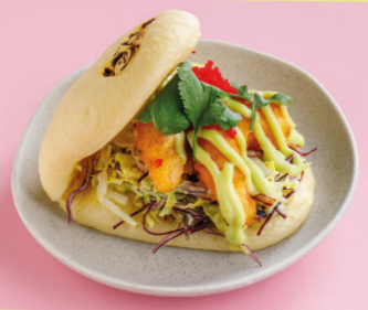
С креветками темпура и сладким васаби 490