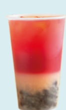
PRICKLY PEARS & LYCHEE Prickly pears, lychee, lime, black tea