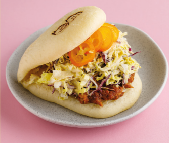
С тункой конфи и пекинской капустой 450