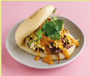
Beef with curry sauce 490