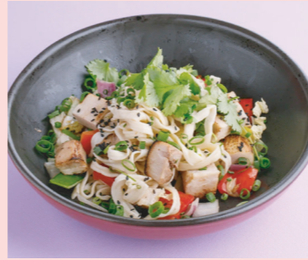
Pork with ginger BBQ 550