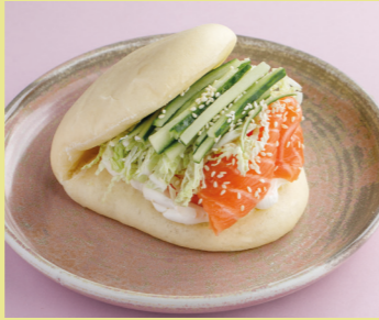
Lightly salted salmon with cream cheese 590