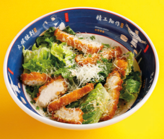
Азиатский Цезарь с цыплёнком кацу 550