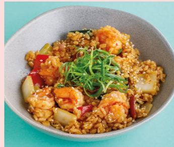
Prawns with Tom Yum sauce 570