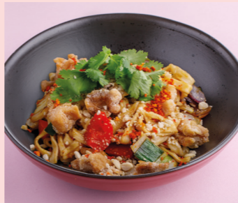
Chicken thigh with orange teriyaki 520