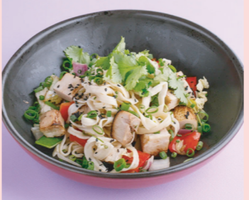
Со свининой и имбирным BBQ 550