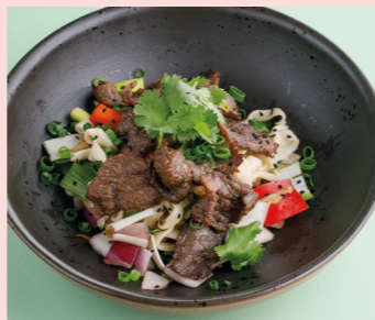
Beef with peppery unagi 550