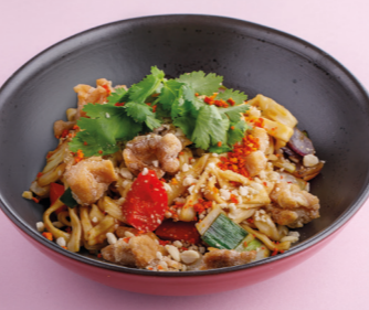
С куриным бедром и апельсиновым терияки 520