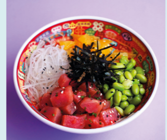
С тунцом и трюфелем 670