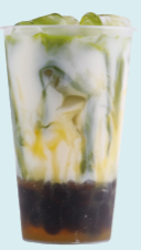
MATCHA & BANANA Матча, банан, молоко