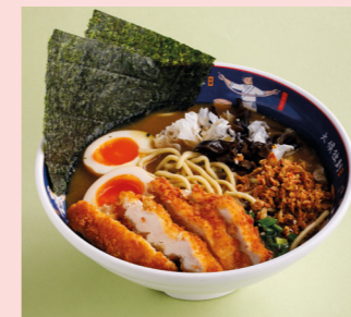
Truffel Ramen Paitan with chicken 590