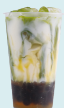
MATCHA & BANANA Matcha, banana, milk