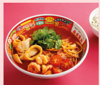
Тайский суп с морепродуктами 720