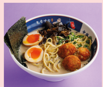
Сливочный Рамен с древесными грибами и куриными митболами 590