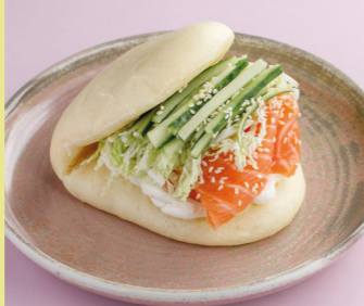
С лососем слабой соли и сливочным кремом 590