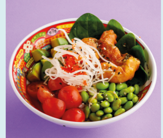
С креветками темпура 650