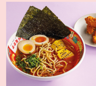
Ramen Paitan with prawns 650