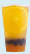
JASMINE & PASSION FRUIT Жасмин, маракуйя, апельсин