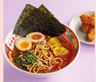
Рамен Пайтан с креветками 650