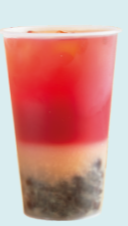
PRICKY PEARS & LYCHEE Красная опунция, личи, лайм, чёрный чай