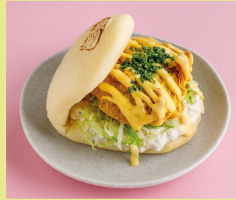
Crispy chicken with mango-chili sauce 490