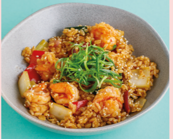
С креветками и соусом том ям 570