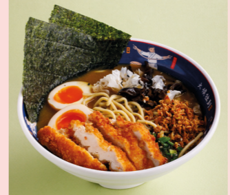
Трюфельный Рамен Пайтан с цыплёнком 590