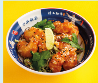
Bang Bang prawns 670