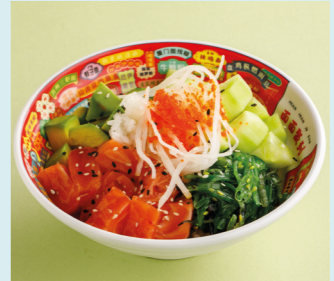
С лососем и авокадо 750