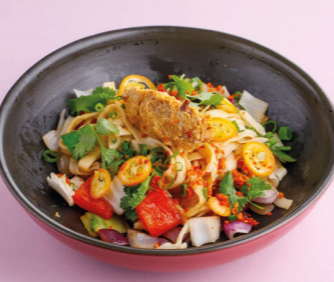
С томлёной тункой и апельсиновым хойсин 520