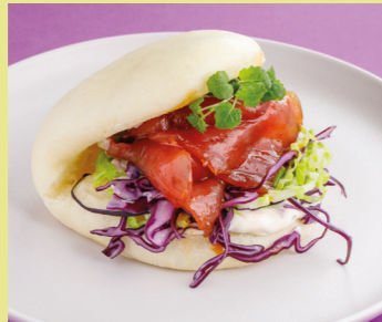
Tuna with fennel and ponzu sauce 520