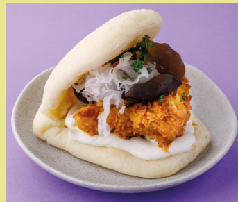
Crispy chicken with asian mushrooms and truffle unagi 470