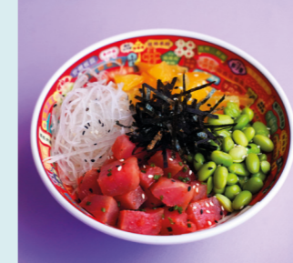
Tuna and truffle 670