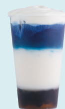
SALTED CARAMEL & CHEESE ANCHAN Anchan, salted caramel, coconut milk, cheese foam