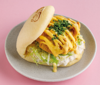
С хрустящим цыплёнком и соусом манго-чили 490