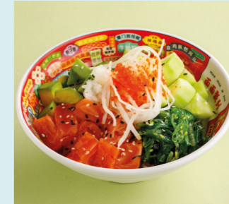
Salmon and avocado 750