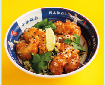
Креветки Bang Bang 670