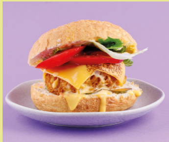
Bao-burger with crispy chicken and cheddar-curry sauce 520