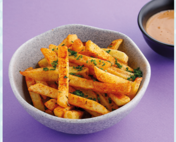
Картофель фри с соусом 270