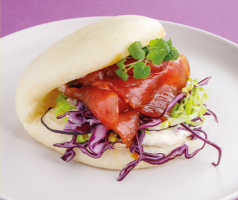
С тунцом, фенхелем и соусом понзу 520