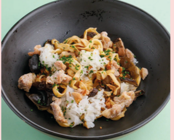
С куриным бедром, древесными грибами и трюфельным унаги 490