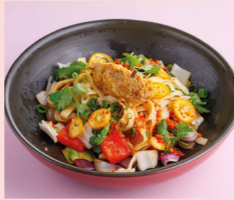
Stewed duck with orange hoisin 520