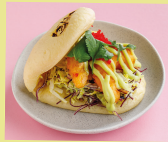
Tempura prawns with sweet wasabi 490