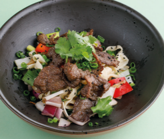
С говядиной и перечным унаги 550