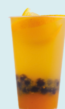
ROOIBOS & CITRUS Rooibos, tangerine, orange