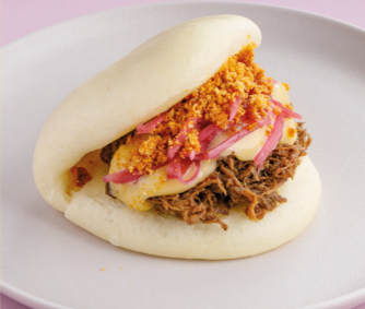
С рваной свининой и японским майонезом 450