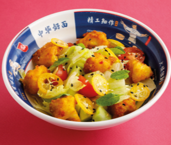
Салат с хрустящим куриным бедром и лаймовым айоли 520