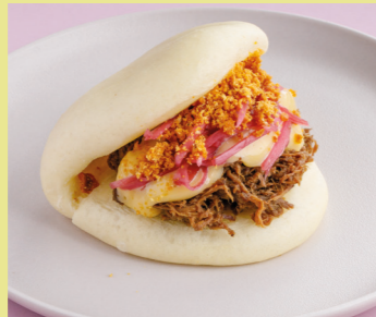
Pulled pork with japanese mayonnaise 450