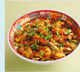
Karaage chicken 550