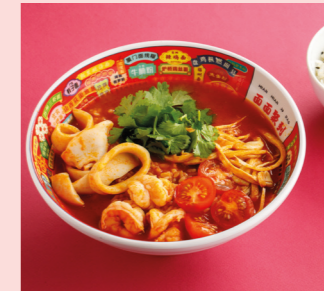
Thai soup with seafood 720