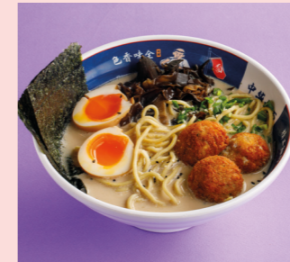
Creamy Ramen with tree mushrooms and chicken meatballs 590