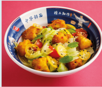
Salad with crispy chicken thigh and lime aioli 520