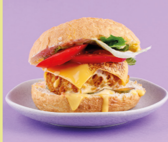
Бао-бургер с хрустящим цыплёнком и соусом чеддер-карри 520