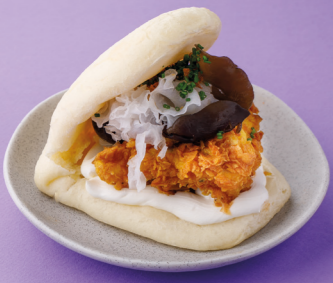
С хрустящим цыплёнком, азиатскими грибами и трюфельным унаги 470