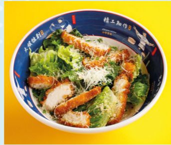
Asian Caesar salad with chicken katsu 550