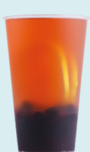
BLACKCURRANT & LEMON Milk oolong, blackcurrant, lemon