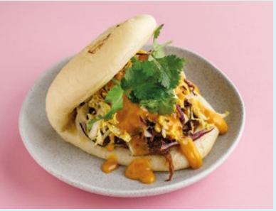
С говядиной и соусом карри 490