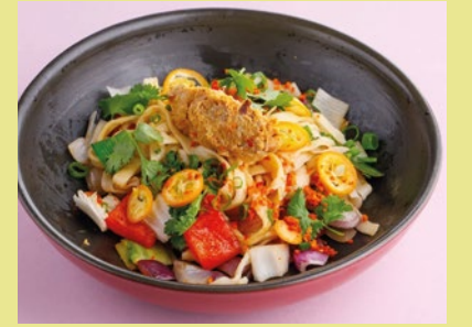
С томлёной уткой и апельсиновым хойсин 580