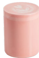
Матча латте розовая