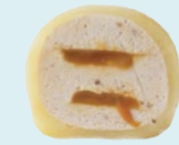
БАНАН-СОЛЁНАЯ КАРАМЕЛЬ 140 ккал