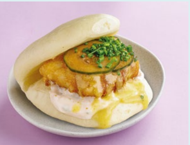
С треской и соусом лаймовый айоли 490