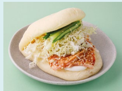
С форелью и цитрусовым кремом 650