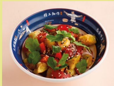
Салат с хрустящими баклажанами и томатами 490