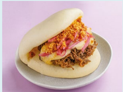
С рваной свининой и японским майонезом 390