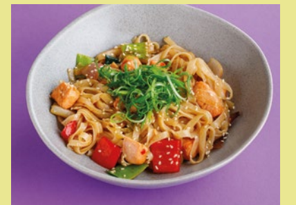
С форелью и цитрусовым понзу 790