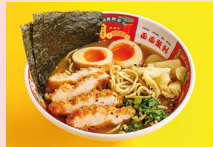
Рамен Пайтан с хрустящим цыплёнком 620