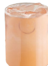
Азиатский молочный чай