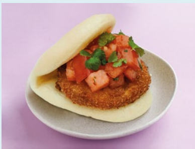
С баклажаном кацу и томатами 390