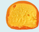
МАНГО-МАРАКУЙЯ 150 ккал