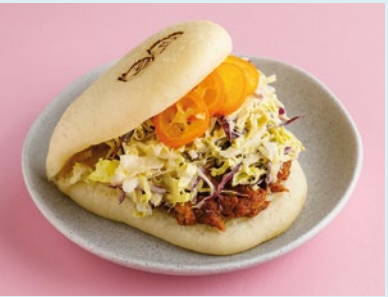
С уткой конфи и пекинской капустой 480