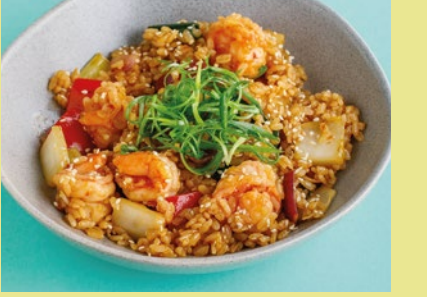
С креветками и соусом Том ям 680