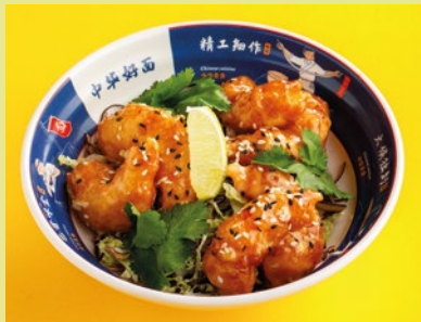
Хрустящие креветки Bang Bang 590