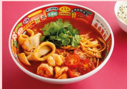
Том ям с кокосовым молоком 720