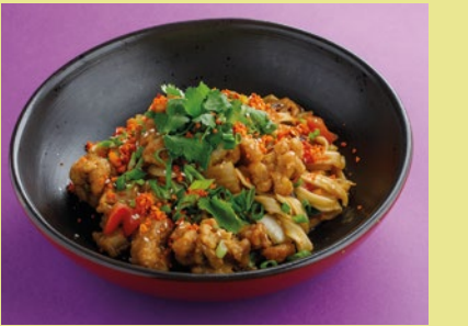
С куриным бедром и соусом карри 580