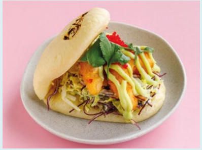
С креветками темпура и сладким васаби 480