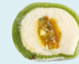
ЛЕМОНГРАСС-ЮДЗУ 150 ккал

290 - 1 шт | 270 - при покупке от 3 шт WOW