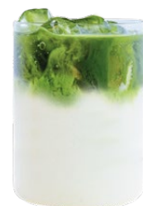
Матча тоник личи