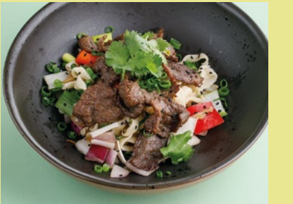
С говядиной и перечным унаги 690