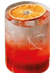
Вишня- розовый перец