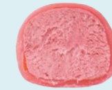
МАЛИНА 100 ккал