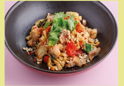
С куриным бедром и апельсиновым терияки 580