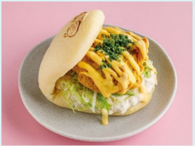
С хрустящим цыплёнком и соусом манго-чили 480