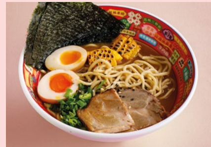
Рамен Тонкоцу со свининой 650