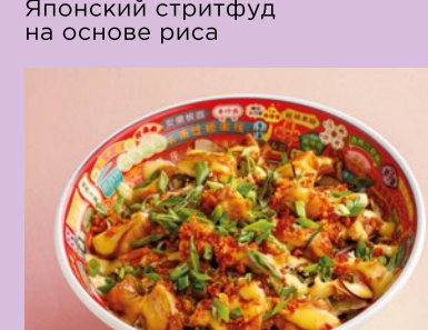
С курицей караге 590