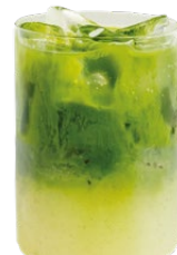
Матча тоник киви