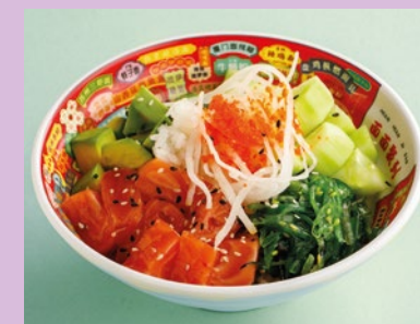
С форелью и авокадо 820