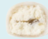
КОКОС-МИНДАЛЬ 140 ккал