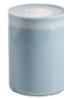
Матча латте голубая