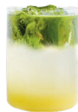
Матча тоник ананас