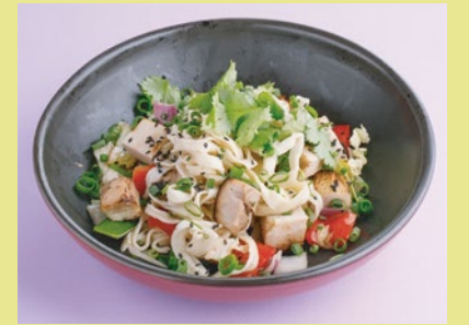
Со свининой и имбирным bbq 490