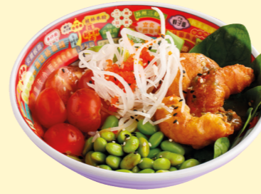
С креветками темпура, авокадо и бобами эдамаме 720