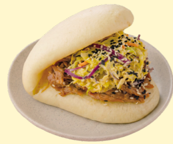
С уткой конфи и коул слоу 490