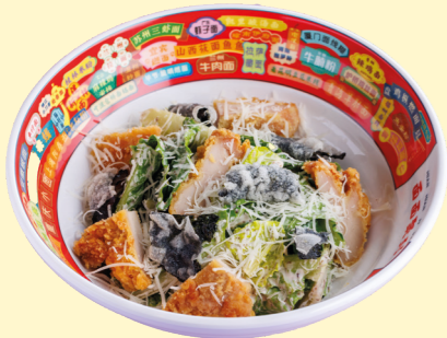
Азиатский Цезарь с куриным бедром 620