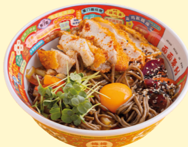
С цыплёнком кацу и ореховым соусом 650