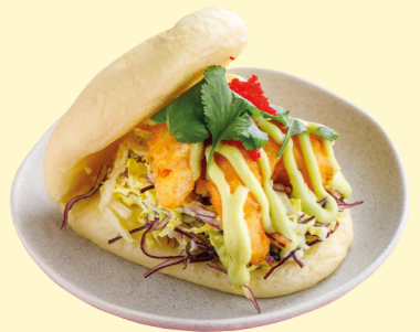
С креветками темпура и сладким васаби 590