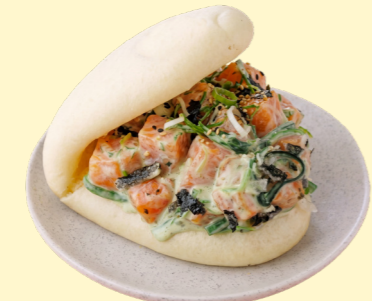
С форелью, чукой и сливочным соусом 690