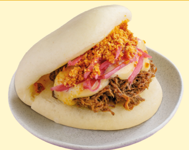
С рваной свиной и японским майо 490