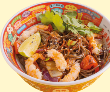
С креветками и соусом из лемонграсса 690