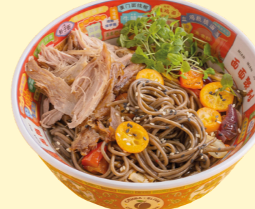
С уткой и апельсиновым терияки 650