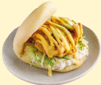
С хрустящим цыплёнком и соусом манго-чили 490

Паровые булочки из пшеничного теста с начинкой на ваш выбор