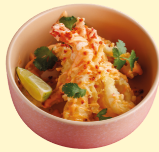
Хрустящие креветки Бэнг-Бэнг и брокколи темпура 750