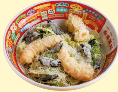
Азиатский Цезарь с креветками темпура 720