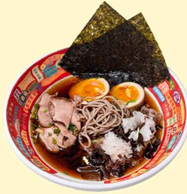
Сёю с уткой конфи, ледяными грибами и лапшой соба 650