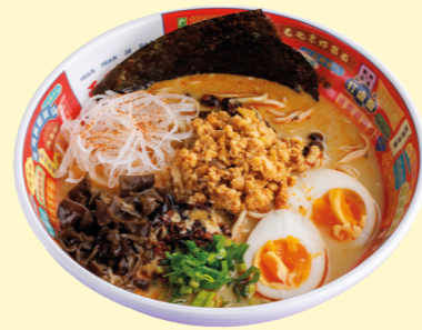
Пайтан с пряным цыплёнком, ароматным маслом и лапшой соба 690