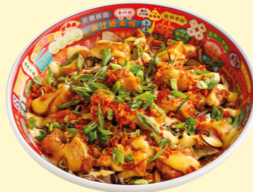
С курицей караге, коул слоу и арахисом чили 620