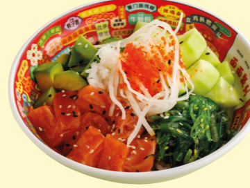
С форелью, авокадо и чукой 790