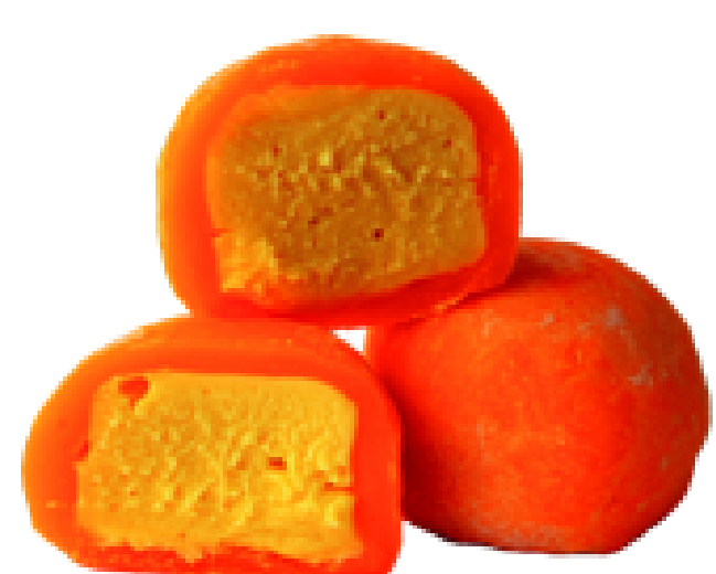
130 МАНГО-МАРАКУЙЯ mango-passion fruit

Наборы моти в подарочной упаковке: 790 / 1550 / 2250 3 шт / 6 шт / 9 шт