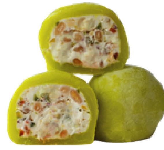
120 ОРЕХИ-СЛИВОЧНЫЙ КРЕМ nuts-cream cheese