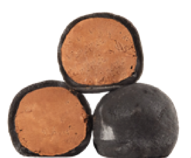
120 МОЛОЧНЫЙ ШОКОЛАД milk chocolate