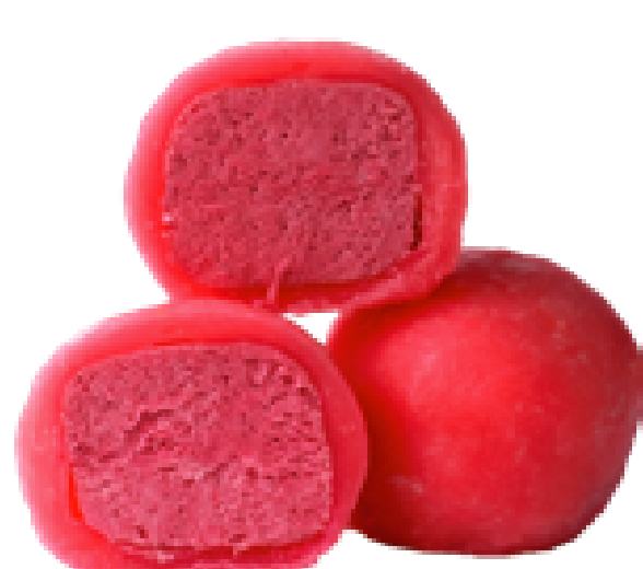
70 МАЛИНА raspberry