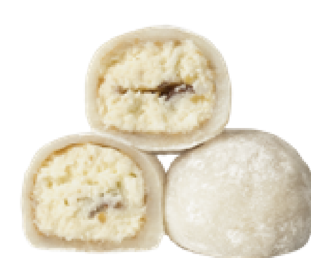
120 КОКОС-МИНДАЛЬ coconut-almond