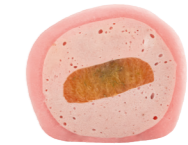
BUBBLE GUM-YUZU 150 kcal