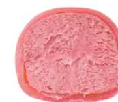
МАЛИНА 100 ккал

Традиционный японский десерт из рисовой муки со сливочно-фруктовыми начинками