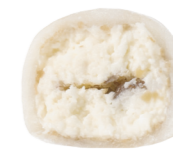
КОКОС-МИНДАЛЬ 140 ккал