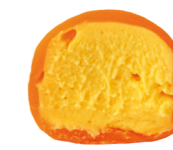
МАНГО-МАРАКУЙЯ 150 ккал