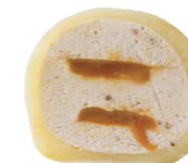
БАНАН-СОЛЁНАЯ КАРАМЕЛЬ 140 ккал