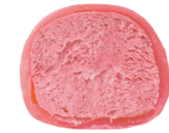
RASPBERRY 100 kcal

Traditional Japanese dessert made from rice flour with creamy and fruit fillings