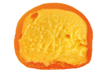
MANGO-PASSION FRUIT 150 kcal