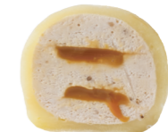
BANANA-SALTED CARAMEL 140 kcal