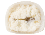
COCONUT-ALMOND 140 kcal