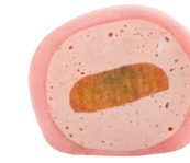
БАБЛ ГАМ-ЮДЗУ 150 ккал