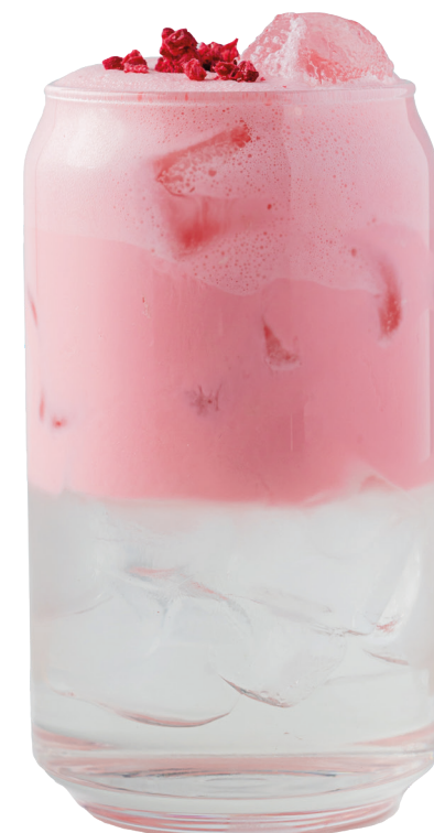
Розовая матча с малиной и кокосовой водой 390 Р | 450 мл