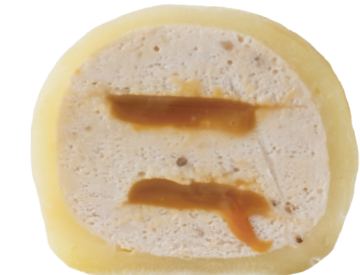
Банан-солёная карамель 140 ккал