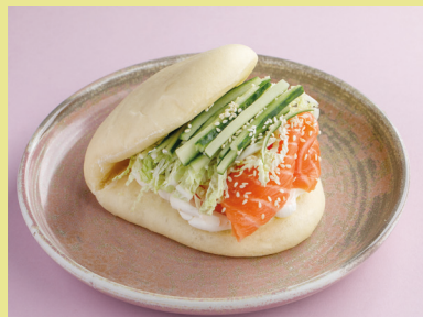
С лососем слабой соли и сливочным кремом 550