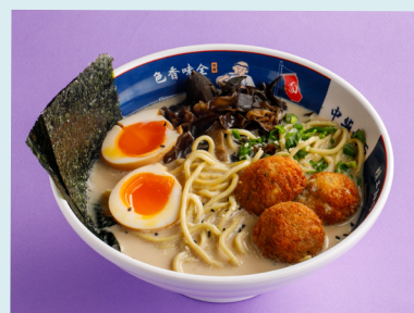
Creamy Ramen with tree mushrooms and chicken meatballs 590