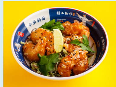
Хрустящие креветки Bang Bang 620