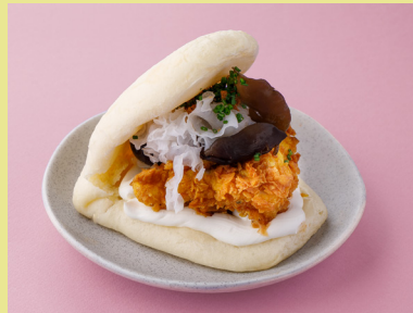
Crispy chicken with asian mushrooms and truffle unagi 420