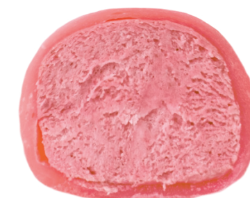
Малина 100 ккал