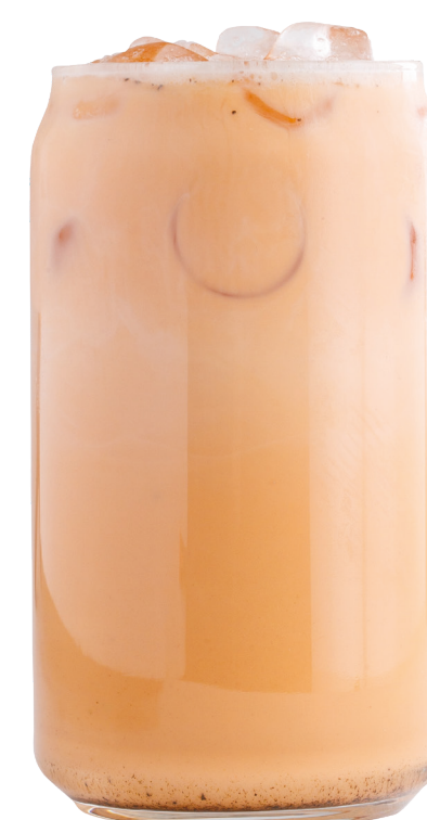
Азиатский молочный чай 390 Р | 450 мл