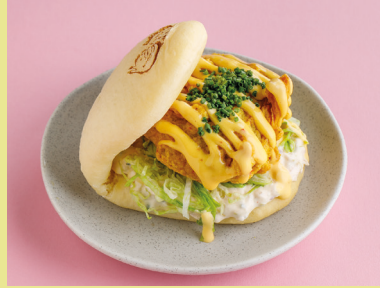
Crispy chicken with mango-chili sauce 490