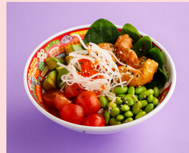
С креветками темпура 690