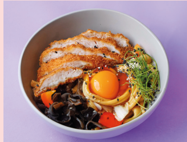
Chicken katsu with nut sauce 590