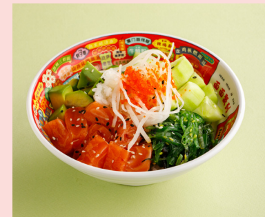
Salmon and avocado 790