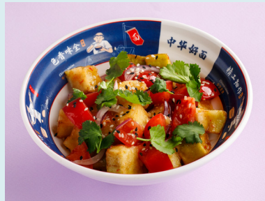
Салат с хрустящими баклажанами и томатами 490