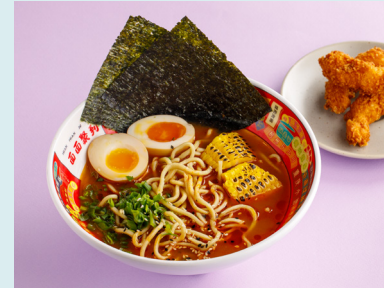
Рамен Пайтан с креветками 620