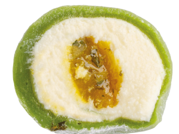
Лемонграсс-юдзу 150 ккал