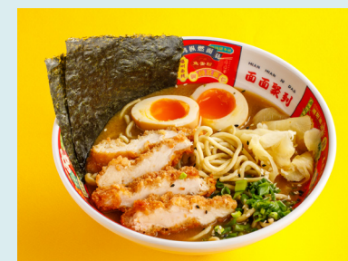
Paitan Ramen with crispy chicken 620