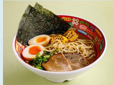
Tonkotsu Ramen with pork belly 590