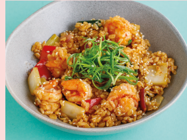
С креветками и соусом том ям 650