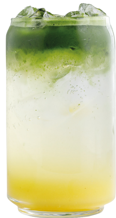
Матча-тоник ананас 390 Р | 450 мл