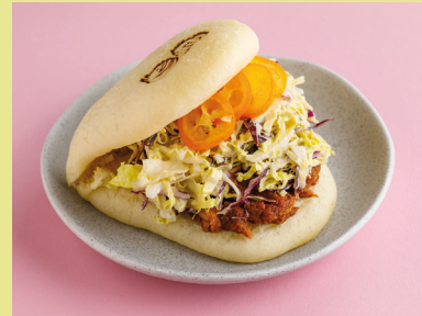
С уткой конфи и пекинской капустой 450