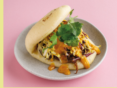
Beef with curry sauce 550