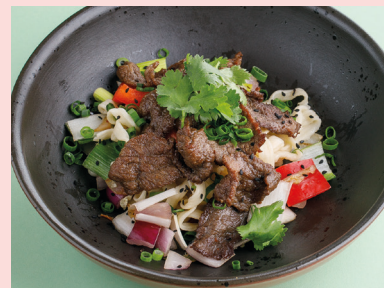
С говядиной и перечным унаги 590