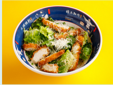
Crispy chicken salad with smoked tuna sauce 550