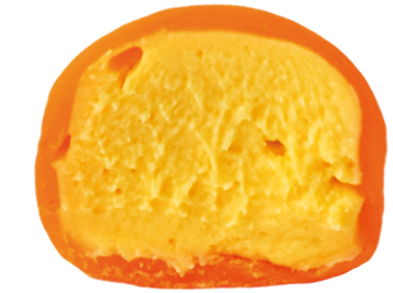
Манго-маракуйя 150 ккал

280 – 1 шт 260 – при покупке от 3 шт wow