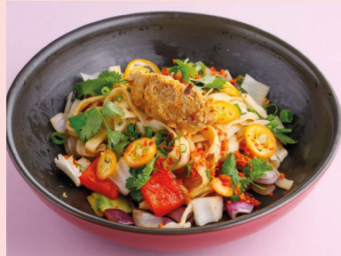
Stewed duck with orange hoisin 550