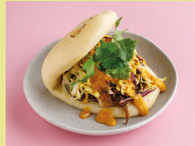
С томлёной говядиной и соусом карри 550