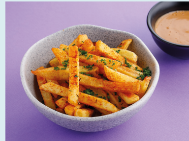
Картофель фри с соусом на выбор 290