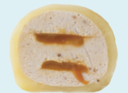
BANANA-SALTED Caramel 140 kcal