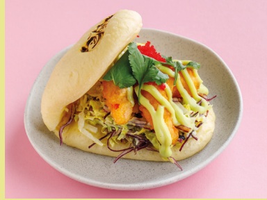
Tempura prawns with sweet wasabi 490