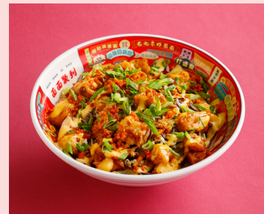
С курицей караге 590