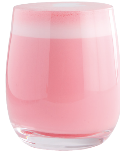
Матча латте розовая 350 Р | 350 мл