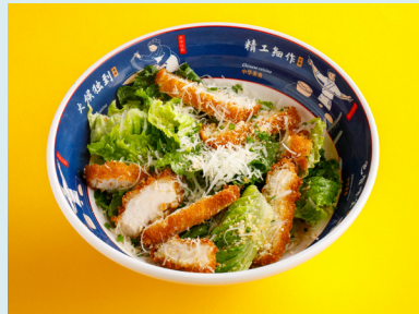
Салат с хрустящим цыплёнком и соусом из копчёного тунца 550