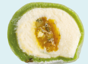
LEMONGRASS-YUZU 150 kcal