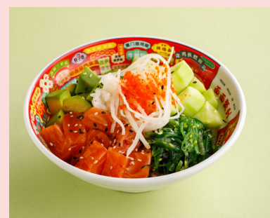
С лососем и авокадо 790