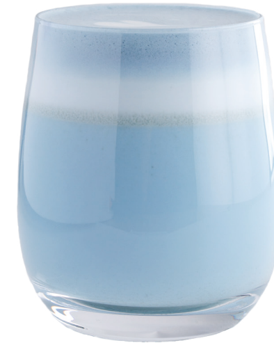
Матча латте голубая 350 Р | 350 мл