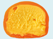
MANGO-PASSION FRUIT 150 kcal