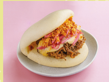
Pulled pork with japanese mayonnaise 420