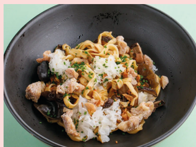
Chicken thigh, tree mushrooms with truffle unagi 490