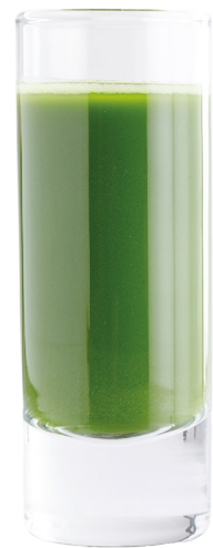
Матча шот 260 Р | 50 мл