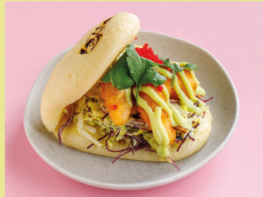
С креветками темпура и сладким васаби 490