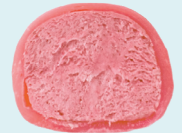
RASPBERRY 100 kcal