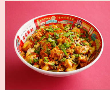
Karaage chicken 590