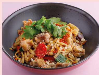
Chicken thigh with orange teriyaki 520