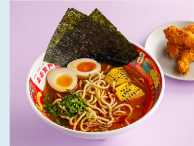
Paitan Ramen with prawns 620