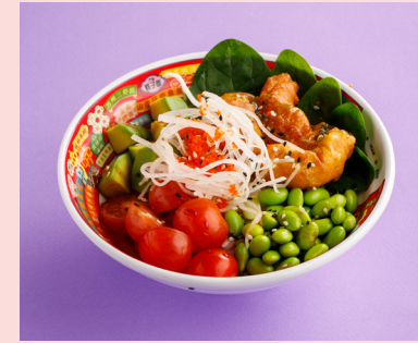
Tempura Prawns 690