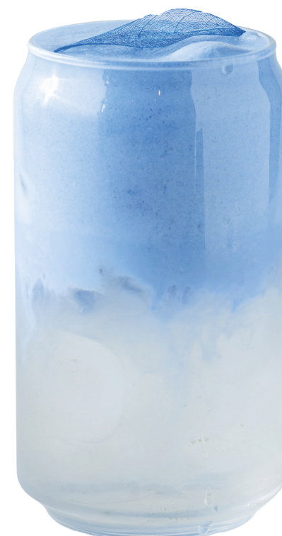
Голубая матча с кокосовой водой 390 Р | 450 мл