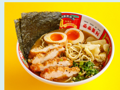
Рамен Пайтан с хрустящим цыплёнком 620