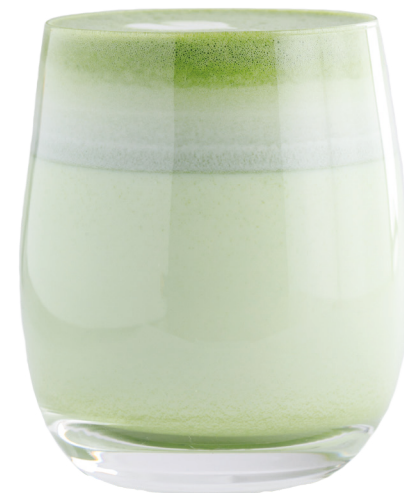
Матча латте 350 Р | 350 мл