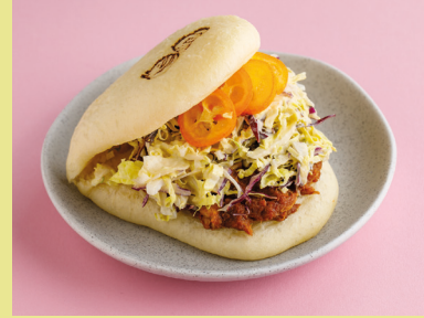
Duck confit with Chinese cabbage 450