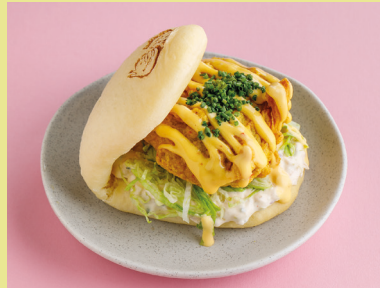
С хрустящим цыплёнком и соусом манго-чили 490